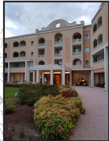
4* Hotel Neroniane